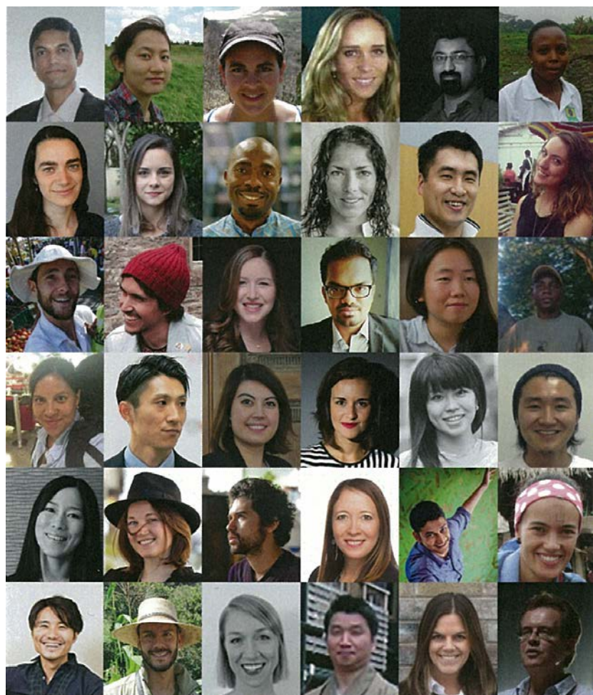
NELIS 世界大会 2017 次世代リーダーサミット 35名の参加者