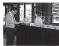
近江八幡日本橋ヴィレッジたねや中核店舗「つつむ」の販売員さん。接客に当たって提供しているサービス。