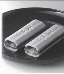
上) 「ふくみ天子」 右) 近江八幡日本橋ヴィレッジたねや中核店舗 下) 近江八幡日本橋ヴィレッジクラブリエ工場 敷下下「ルームカーテン」