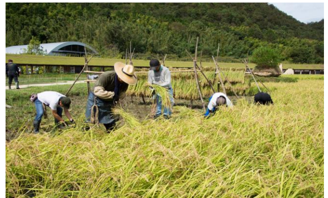
▲2022年の稲刈りの様子