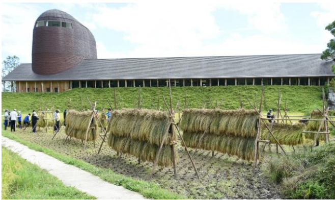
▲稲穂を天日干しにする稲架 ほし がけの風景

8年目の今年、「学びの田んぼ」は入社2年目の従業員を対象にした研修の場にもなっています。製造や販売など所属部署での仕事にくわえ、たねやグループが大切にしている素材と自然にふれる機会として2023年より始めた新たな試みです。稲刈りには例年どおりキャンディーファームを中心にたねや・クラブハリエの従業員有志も参加します。