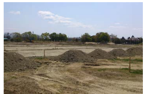
▲2013年 ラ コリーナ予定地

2009年秋には「北之庄たねやヴィレッジ計画」をメディアに発表。販売や製造、観光、学習を軸にした複合施設を建設予定でしたが、打ち合わせを進めるなかで違和感が募り、最終的に「私たちが目指したいものではない」と判断。数億かかった計画を白紙に戻しました。