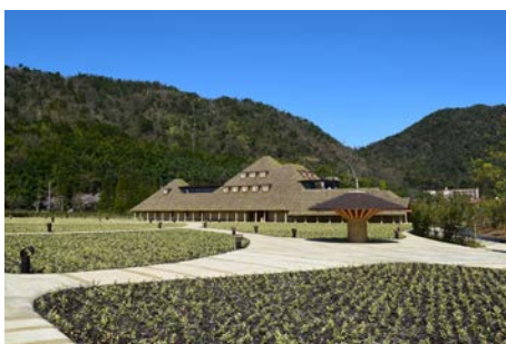
▲2015年 オープン直前のラ コリーナ

そのなかで定まったコンセプトこそ「自然に学ぶ」。さらに2012年、建築家・建築史家の藤森照信氏にご縁をいただいてからは計画も順調に進み、2015年1月のメインショップオープンに至りました。